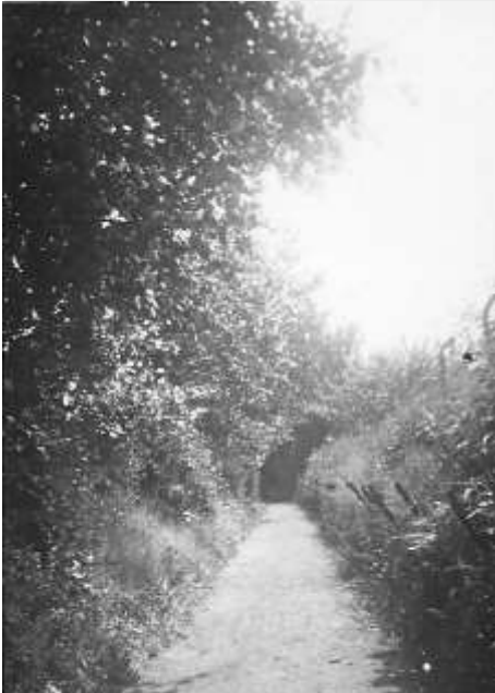
Kerkpad Terborgsteeg-Kerkstraat 1937