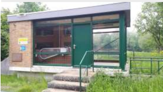
Gemaal Westerpolder, Bestuur waterschap de Westerpolder, 1969

In de Nesciolaan en het doodlopende deel van de Meerweg staat aan een brede sloot een klein gemaal. Een aan de gevel geschroefde gedenkplaat meldt dat het toebehoorde aan het toenmalige waterschap De Westerpolder, en dat het gemaal op 19 december 1969 in gebruik werd gesteld door mr. F.W. van Ketwich Verschuur, destijds burgemeester van Haren. Het oude gemaal bestond sinds 1915 uit een elektromotor die was geplaatst in wat resteerde van watermolen De Westerpolder uit 1862. Die molen – een achtkante grondzeiler – stond aan het Harener vaartje, en bemaalde de Westerpolder. Het enige dat nu nog aan molen De Westerpolder herinnert, is de molenaarswoning die, eveneens in opdracht van het waterschap, in 1888 naast de molen werd gebouwd. Dat pand aan de Nesciolaan bestaat nog steeds. De molenaarswoning werd in 1974 geres-taureerd.