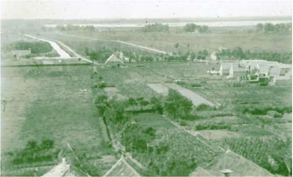
Westzijde van Haren met het Harener vaartje

De fietstocht langs historische kunstwerken in Haren wordt georganiseerd door de Harense Historische Kring 'Old Go' in het kader van Open Monumenten Dag 2021.