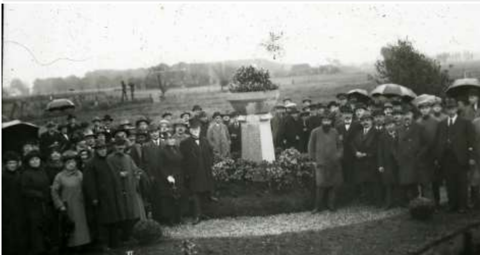
Onthulling bloembak 1923