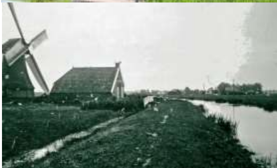
Molen en Harener vaartje