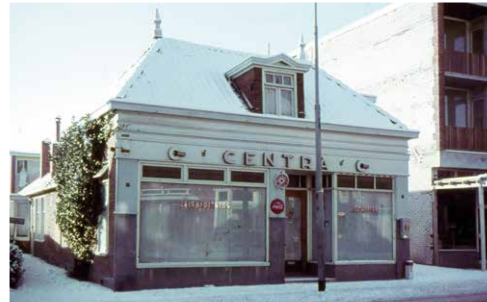
34C De Centra-winkel vlak voor de afbraak. De Centrumflat is al grotendeels gereed.